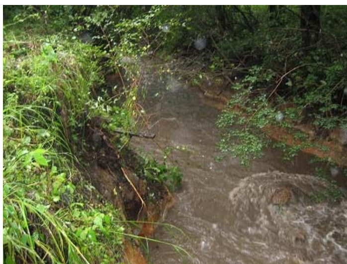
写真 1 (左) : 平時の状況