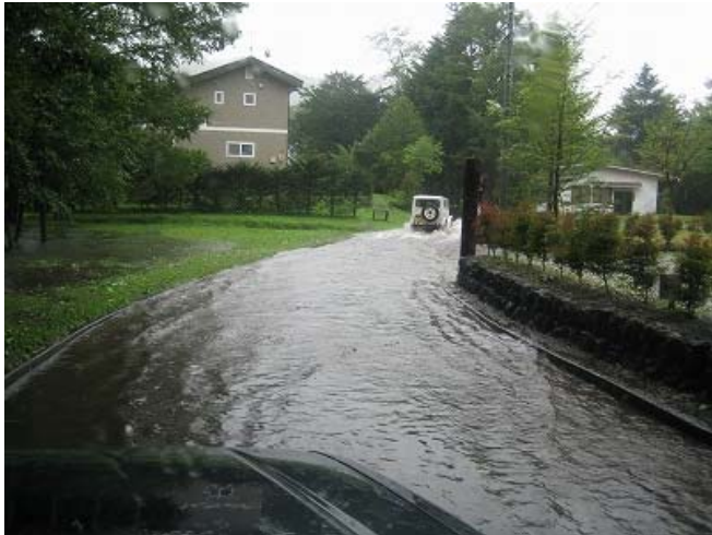
写真3 冠水した道路の状況