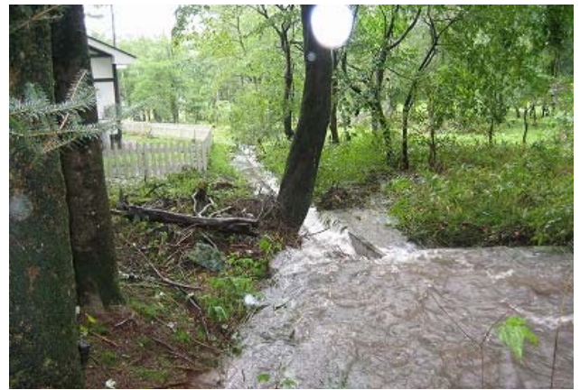
写真6 7日9時の沢の状況、今の度は家屋敷地まで水位が及ばなかった