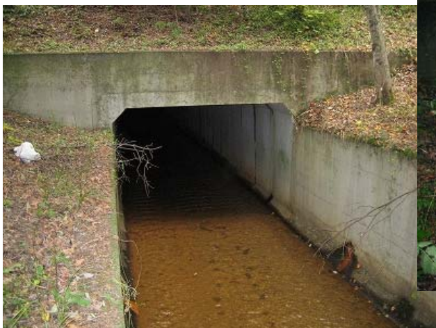
写真7 平時のボックスカルバート