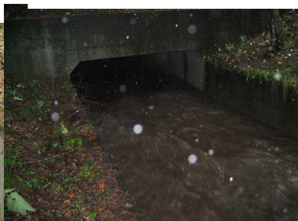
写真8 6日10時のボックスカルバート、凄 い速さで流れていた、閉塞が無かったのは単なる僥倖