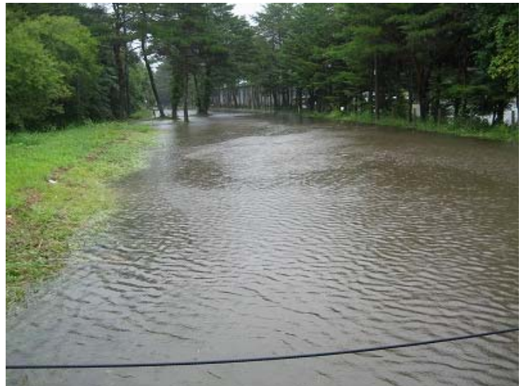
写真4 冠水した道路の状況